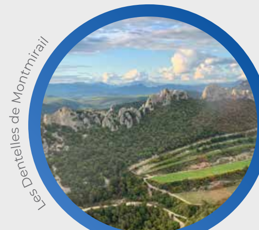
Les Dentelles de Montmirail

Des vols « découverte » pour admirer la Provence vue du ciel ; des Dentelles de Montmirail à Vaison La Romaine en passant par Le Barroux, Bédoin, Beaumes de Venise, Carpentras, Gigondas ou pourquoi pas la Cité des Papes, le Pont d'Avignon et Châteauneuf-du-Pape. Une idée originale pour un cadeau ou pour passionnés de l'aviation. Après un briefing au sol vous décollez pour 30 minutes de vol (de 1 à 3 personnes).